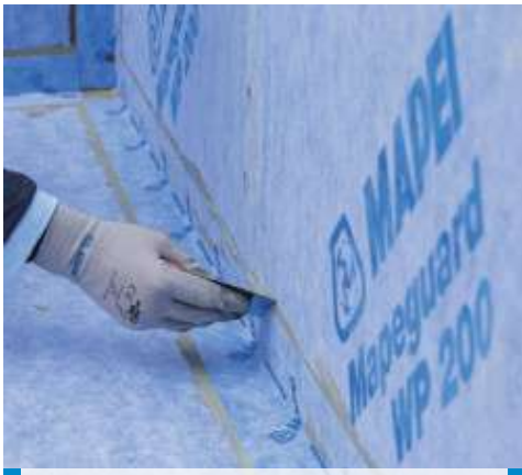
Mapeguard ST bedolgozása