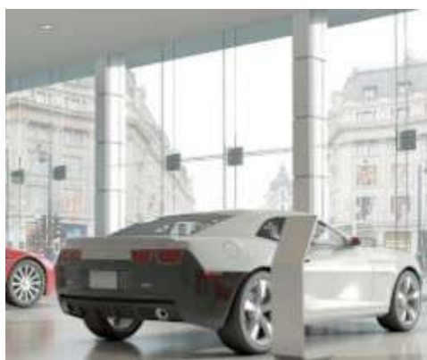
Mapetex System-mel fektetett padlóburkolat