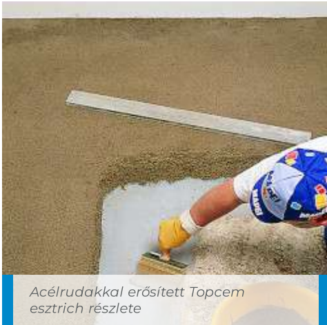
Acélrudakkal erősített Topcem esztrich részlete