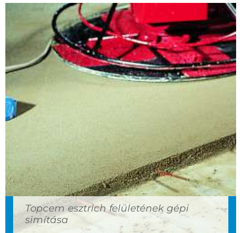
Topcem esztrich felületének gépi simítása