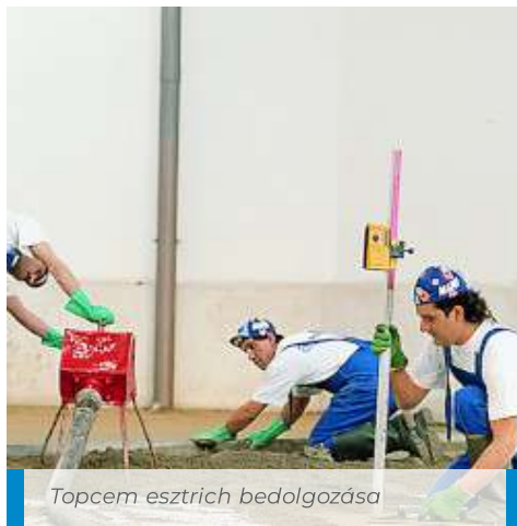
Topcem esztrich bedolgozása