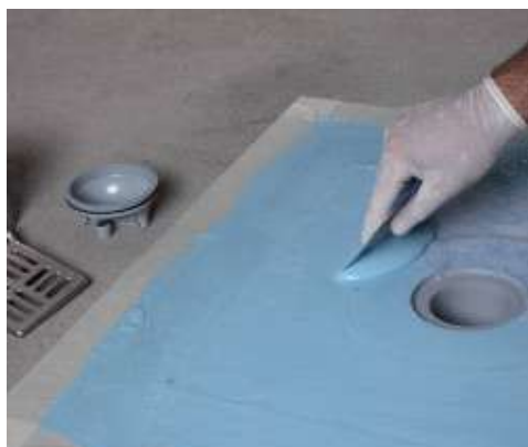
Drain Vertical impregnálása Mapelastic AquaDefense-vel