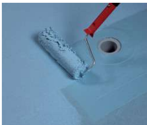
A Mapelastic AquaDefense második rétegének felhordása hengerrel