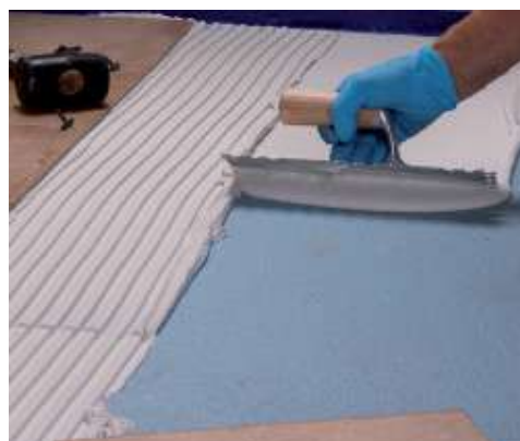
Burkolólapok ragasztása Mapelastic AquaDefense-re