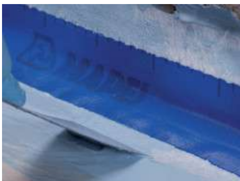
A Mapeband helyére ragasztása Mapelastic AquaDefense-vel fal és padló vízszintes és függőleges felületei között