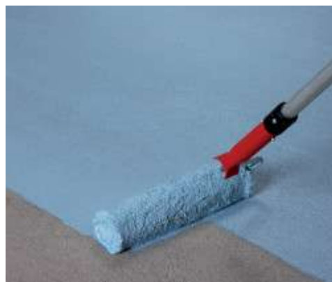
A Mapelastic AquaDefense első rétegének felhordása esztrichre